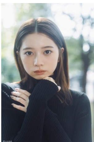
さくらだ 桜田 ひより (21歳)

1988年6月28日生まれ。1998年ドラマ「ひとりぼっちの君に」でデビューし2004年には「3年B組金八先生」にて注目を浴びる。その後、ドラマ、映画、CMなどで幅広く活躍。近年では「釣りバカ日誌 ～新入社員 浜崎伝助～」シリーズや、2021年「バイプレイヤーズ もしも100人の名脇役が映画を作ったら」、2022年「マイファミリー」、2023年「VIVANT」など多数の話題作に出演。2024年1月からはドラマ「春になったら」が放送されている。