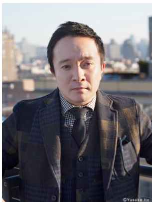
はまだ がく 濱田 岳 (35歳)

1988年6月28日生まれ。1998年ドラマ「ひとりぼっちの君に」でデビューし2004年には「3年B組金八先生」にて注目を浴びる。その後、ドラマ、映画、CMなどで幅広く活躍。近年では「釣りバカ日誌 ～新入社員 浜崎伝助～」シリーズや、2021年「バイプレイヤーズ もしも100人の名脇役が映画を作ったら」、2022年「マイファミリー」、2023年「VIVANT」など多数の話題作に出演。2024年1月からはドラマ「春になったら」が放送されている。